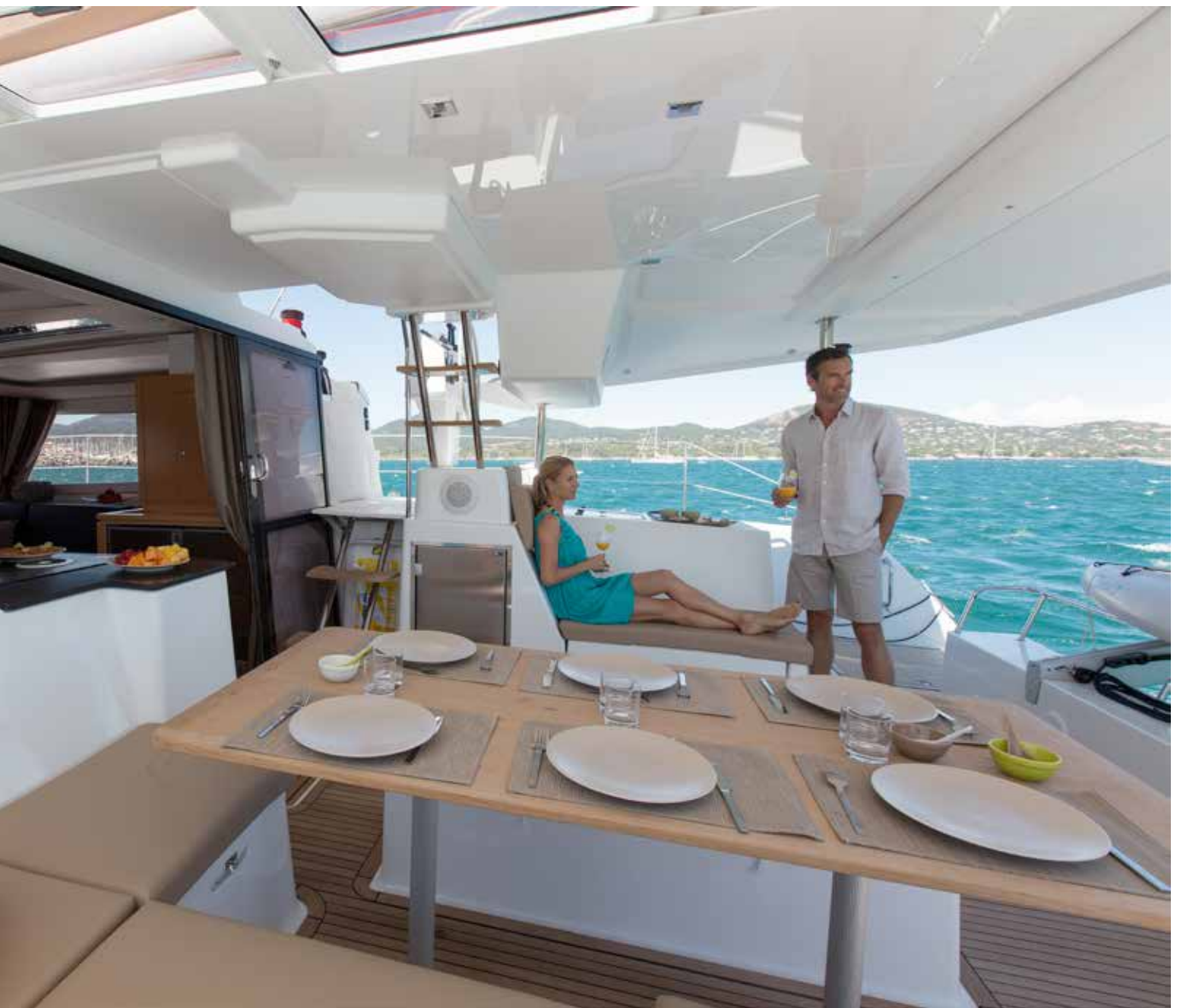
Un carré-cockpit de plain pied

Par l'arrière du cockpit, sur chaque bord, vous avez accès aux larges passavants totalement «flush» qui conduisent à l'avant du bateau et au pied de mât.