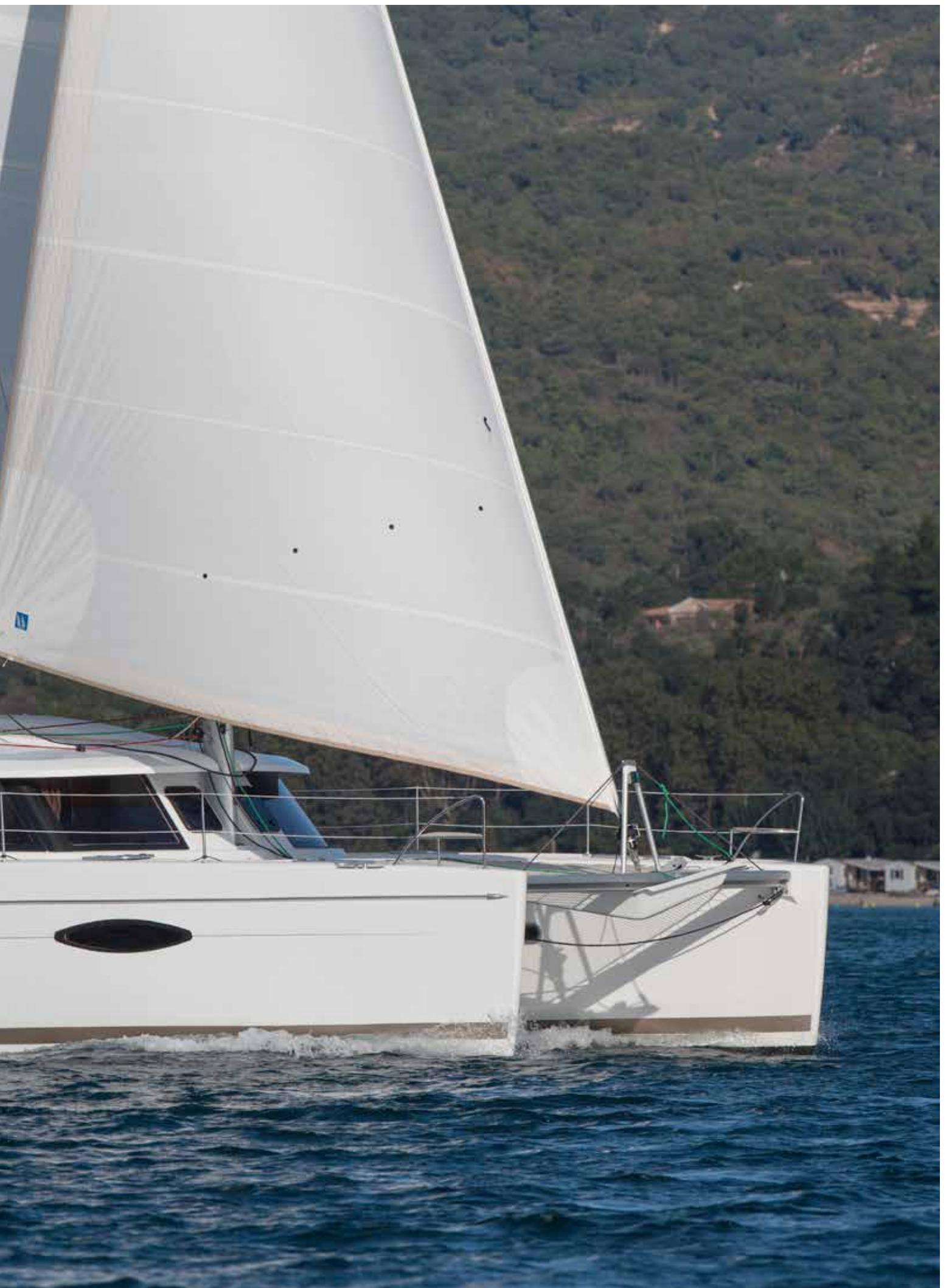
Hélia 44 - Élegance & performance 3